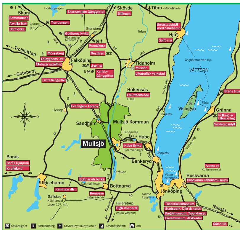
Kartillustration: Louise Design / Konkrettek AB

FALKÖPING Segelflygmuseum Gånggrifter Åsle Tå Ekehagens Forntidsby Dalénmuséet Mössebergdjurpark- lekcenter Falköpings turistbyrå: 0515-88 70 50